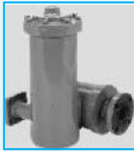
Strainer cum Air Eliminator C35