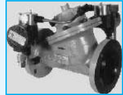
Digital Control Valve- Diaphragm