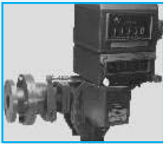
C35 Meter with Preset Valve for Batch Operation