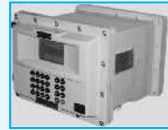
TISI Batch Controller