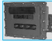
MICROCOMPT Batch Controller