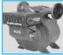
Flow Meter Double Case