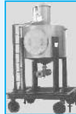
Proving Tank Mobile