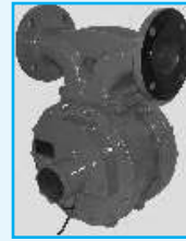
Flowmeter with Pulse Transmitter